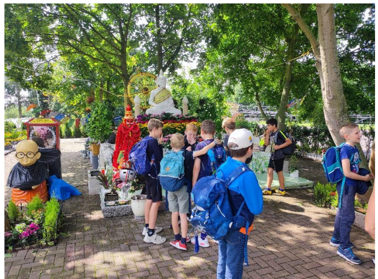
Wir lernen den buddhistischen Tempel und das Kloster (Wat) kennen und sprechen mit einem Mönch.