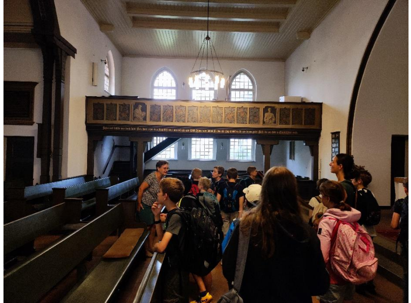
Spannender Besuch bei der Dorfkirche Heinersdorf und auf ihrem Gelände