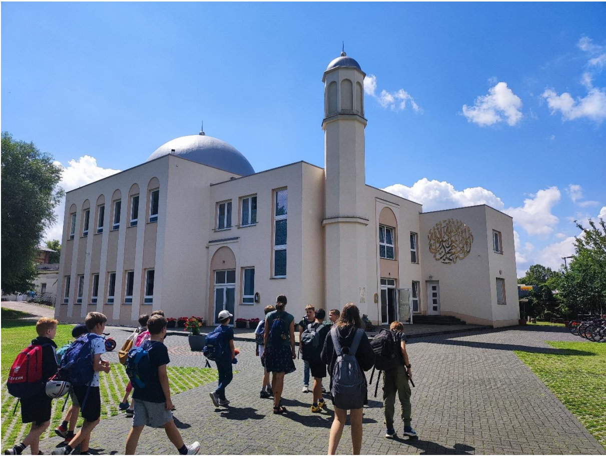
Wir entdecken die Khadija-Moschee.