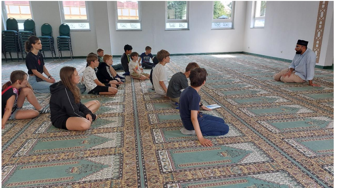
Der Imam erzählt uns von ihrer Geschichte.